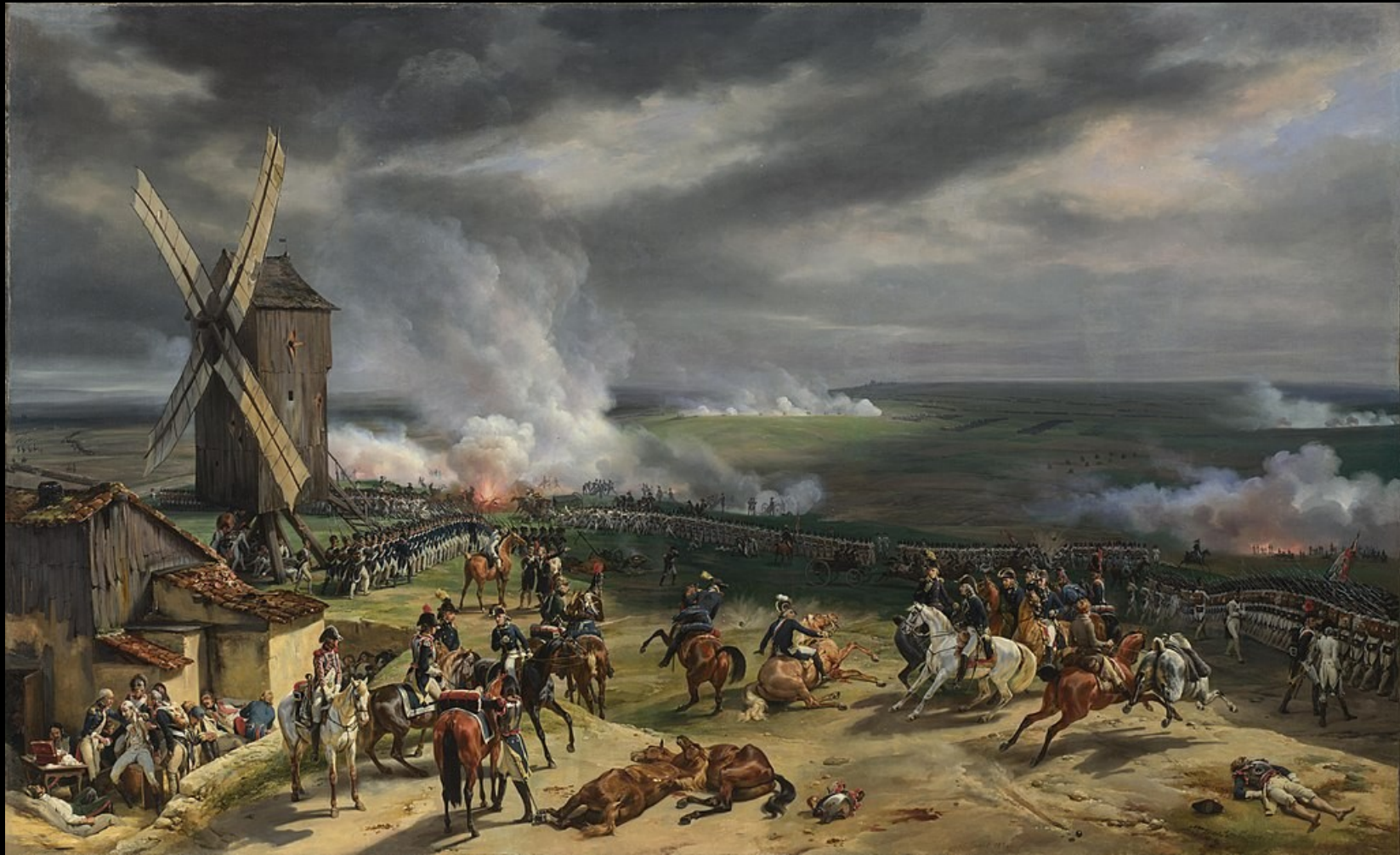
Bataille de Valmy le 20 septembre 1792, Horace Vernet