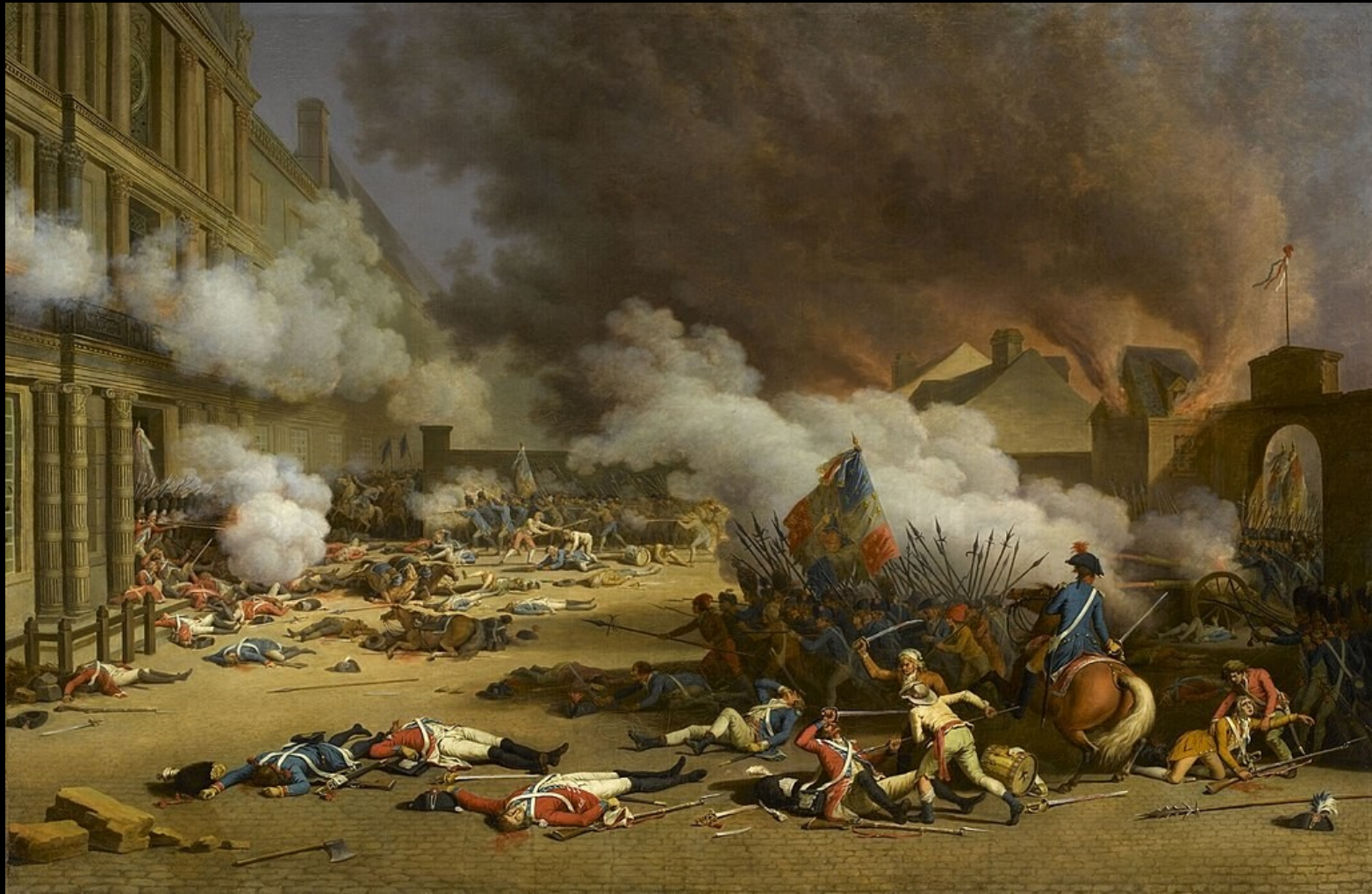
La prise des Tuileries le 10 août 1792, Jean Duplessis-Bertaux, 1793