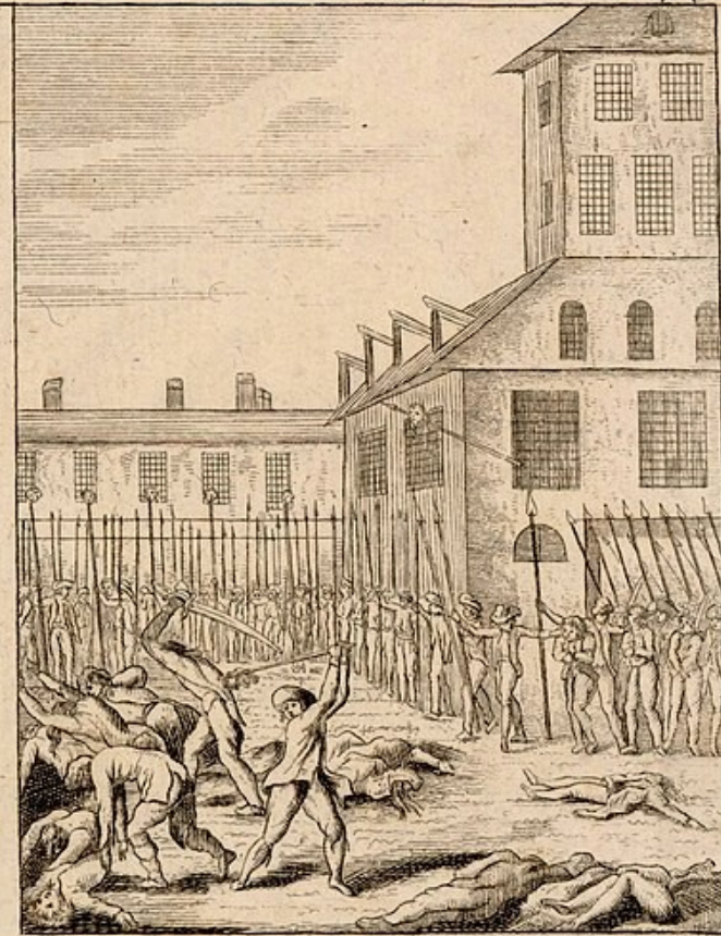
Massacre des prisonniers de la Prison du Chatelet et de la Maison de Bicêtre le deux et trois Septembre et jours suivants, au nombre d'environ huit cents.