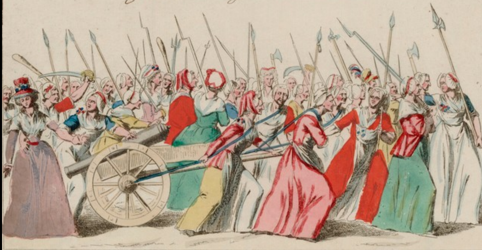
Marche des femmes sur Versailles, 1789

Epoques de la Révolution Fuite de Paris à Versailles