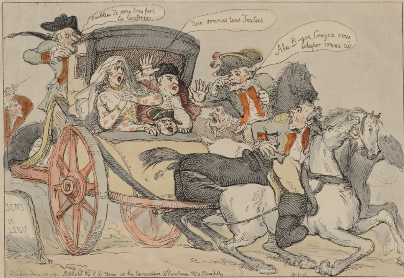
THE GRAND MONARCK DISCOVERED IN A POT DE CHAMBRE. Or the Fugitives turning Tail.