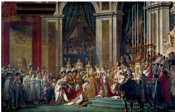
Le sacre de Napoléon, Jacques-Louis David, 1807

À partir de la retraite de Russie en 1812 , l'empire français, qui était trop grand pour rester sous contrôle, commença à se désagréger. Napoléon dut abdiquer et fut exilé à Saint-Hélène après la défaite de Waterloo en 1815 . La France revint à ses frontières d'avant 1792 et la monarchie fut restaurée .